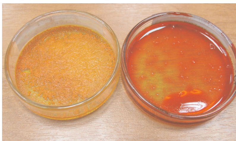
▲ Ukázka dobrého a špatného inkoustu

„Obrovskou a navíc je to velmi těžká otázka, protože záleží na úhlu pohledu toho, kdo nás hodnotí. Pokud jde zákazníkovi pouze o nejnižší cenu, tak jistě najde výhodnější řešení, než mu nabízí naše firma. Není problém koupit třeba na e-tržišti toner za 250 Kč od nějakého domácího kutila. My se ale snažíme naučit zákazníky, aby vyžadovali od svých současných dodavatelů minimálně totéž, co nabízíme my, a v těch případech obvykle naše firma nemá problém obstát. Ale to platí obecně, ať už vyrábíte alternativní tiskové kazety nebo pečete rohlíky. Vždy se najde někdo, kdo to umí levněji.“