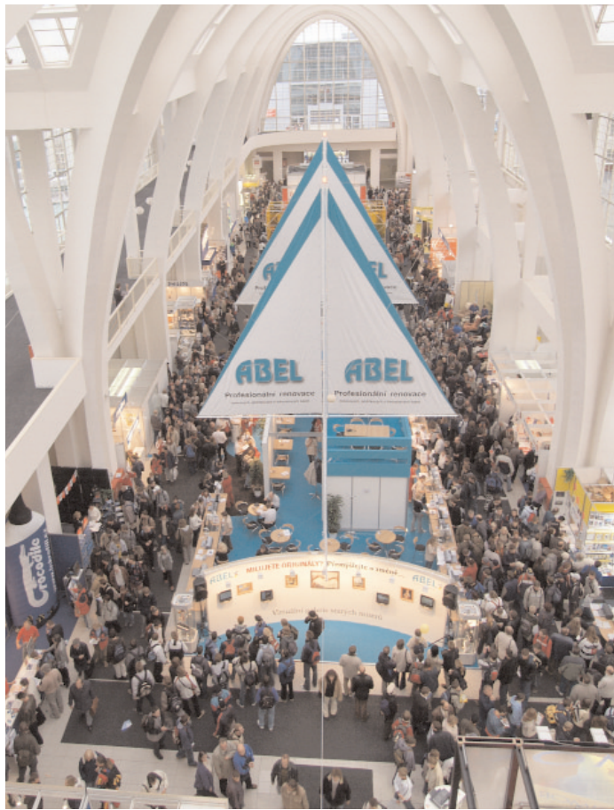
▲ Expozice firmy ABEL na výstavě Invex 2004